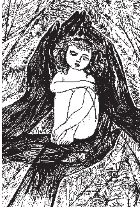
Стасис Красаускас (лит. Stasys Krasauskas). Фрагмент открытки, 1966

Быть ангелом (или агентом) слёз тщетности у своего ребёнка – непростой танец, который состоит из трёх па.