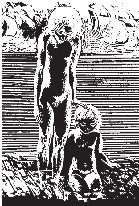
Стасис Красаускас (лит. Stasys Krasauskas). Фрагмент гравюры из цикла эстампов «Вечно живые» (1975).