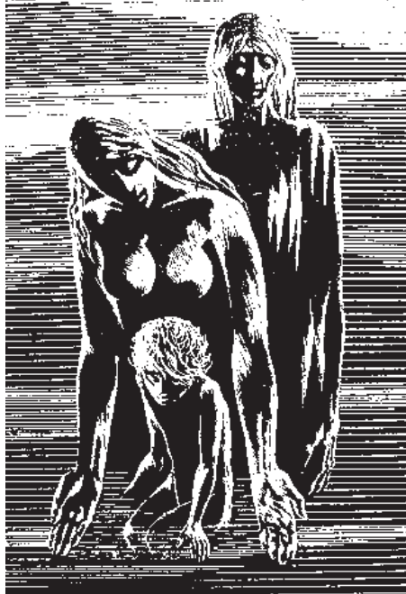
Стасис Красаускас (лит. Stasys Krasauskas). Фрагмент гравюры из цикла эстампов «Вечно живые» (1975).

Не все дети выходят из садика невротиками, но все выходят с покалеченной привязанностью к родителям. Степень покалеченности может быть разной. Она