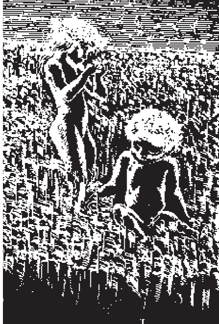
Стасис Красаускас (лит. Stasys Krasauskas). Фрагмент гравюры из цикла эстампов «Вечно живые» (1975).