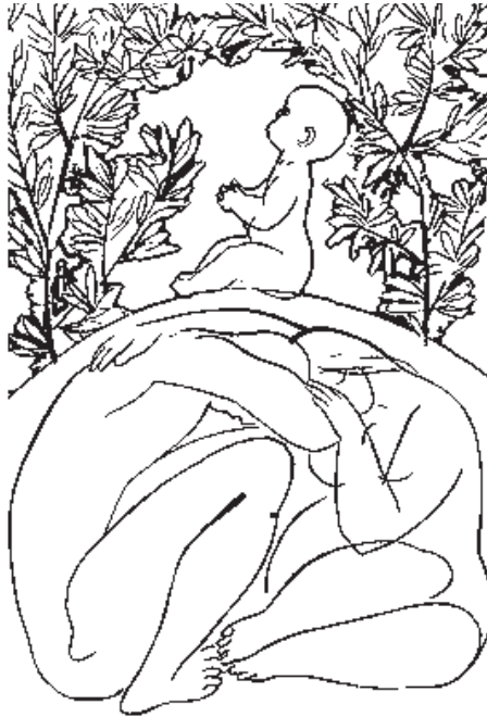
Стасис Красаускас (лит. Stasys Krasauskas). Фрагмент гравюры к книге стихов Эдуардаса Межелайтиса «Человек» (1961-1962).