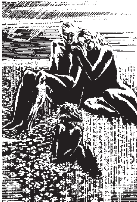
Стасис Красаускас (лит. Stasys Krasauskas). Фрагмент гравюры из цикла эстампов «Вечно живые» (1975).

Старайтесь в течение дня почаще добрым словом вспоминать родителей ребёнка. Привлекайте родителей к «садииковской» жизни: например чья-то мама может раз в неделю прийти на полчаса и почитать детям книжки, а чей-то папа может помочь смастерить кораблики. Чем чаще и охотнее родители будут появляться в садике, тем комфортнее там будет их ребёнку. Проводите неформальные праздники, празднуйте дни рождения вместе с родителями, делайте пикники и субботники. Такие совместные действия намного важнее официальных отчётно-показательных концертов, где родители являются всего лишь потребителями.